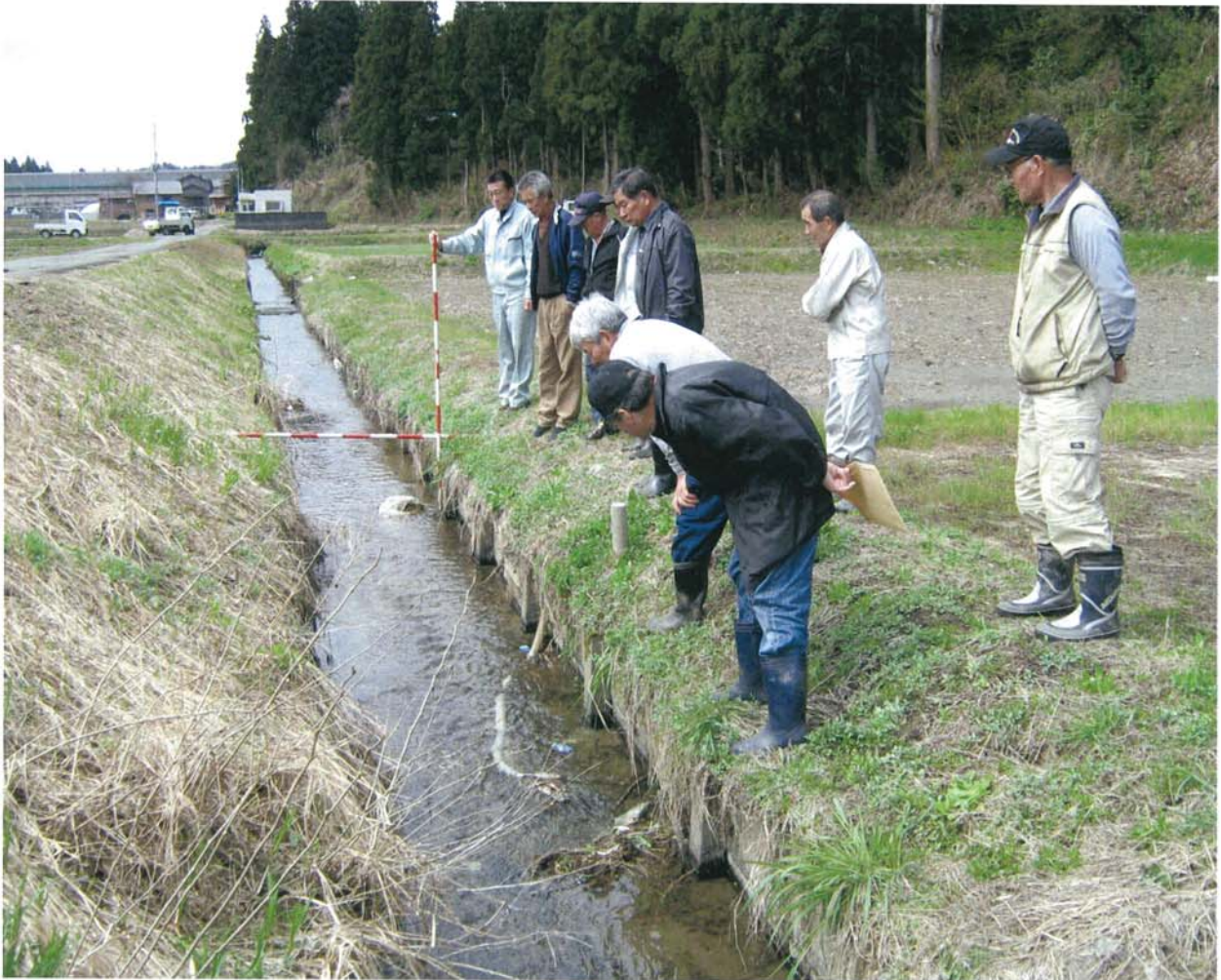
農地・水・環境保全向上対策の活動が始まっています。(施設点検活動)